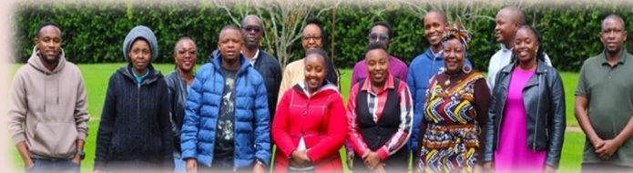
Friends of Mkono – lokale Freiwillige